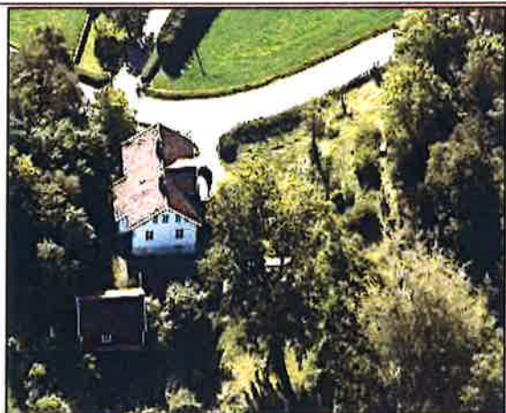
Prestegarden sett mot vest.

for å opprette. Stiftninga kan gjerne stå i nær tilknytning til Kultursogelaget, og ha rapportkanal til dette, sidan begge samstemmande vil - kvar utfrå sine føresetnader - ha kulturrelaterte formål, som vil vere til beste for bygdene her. Utanom bygningsmassen og strandområdet er det elles peika på